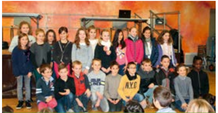
Le conseil fraîchement élu

Sur le sujet des espaces de jeux, qui la concerne au premier chef, la commission Bâtiments-jeux s'est montrée active. En juin, elle a pris part aux travaux du conseil sur le City park (structure ludique sous forme de petit terrain de foot et basket). Cette discussion avec les adultes et le dépouillement des propositions émises suite à l'appel d'offres ont abouti à un report du projet, la réflexion sur le type de revêtement n'étant pas aboutie. Une bonne expérience de gestion et de réalisme, qui profitera au prochain conseil. Le transfert du skate park, de l'ancien parking du Bricomarché à la Plaine d'aventures, a quant à lui été achevé au mois de juillet. Il a nécessité le démontage et la remise en état des modules, assemblés sur une nouvelle couche d'enrobé. De nouveaux modules sont envisagés, le prochain conseil aura encore de quoi réfléchir !