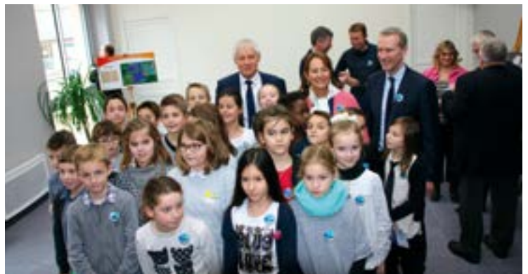
Les conseillers fiers d'accueillir M me Royal