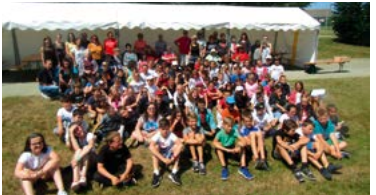
Une belle journée intergénérationnelle