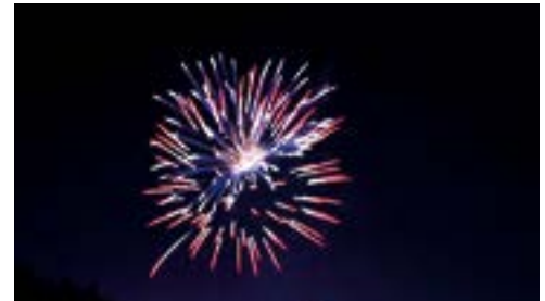
Feu d'artifice du 13 juillet

Sous un ciel clément, les festivités du 13 juillet ont idéalement lancé les vacances d'été. Les animations prévues ont drainé un large public, bien au-delà de la population villainaise, en particulier le feu d'artifice, tiré aux abords d'un stade noir de monde. Auparavant, la randonnée en ville, le défilé aux flambeaux et le spectacle donné par l'orchestre ont progressivement fait monter l'ambiance. Le thème de la magie, retenu cette année, ne pouvait trouver meilleur contexte pour être exprimé.