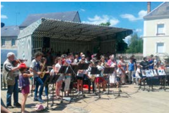
L'école de musique en démonstration sous le soleil

Le 17 juin a, non seulement, été marqué par la fête de la musique, mais également par une journée complète de festivités et d'animations. La grande braderie des commerçants, accompagnée d'une fête foraine, a trouvé son public. Le point d'orgue de l'après-midi a été sans conteste le défilé-exposition de voitures et tracteurs anciens. C'est peu dire que la distribution de tickets par les commerçants, valables pour une promenade, a été appréciée.