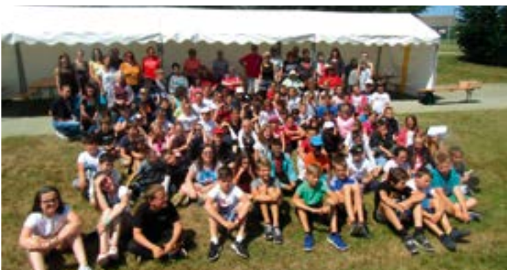
Une belle journée intergénérationnelle