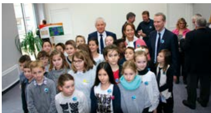
Les conseillers fiers d'accueillir M me Royal