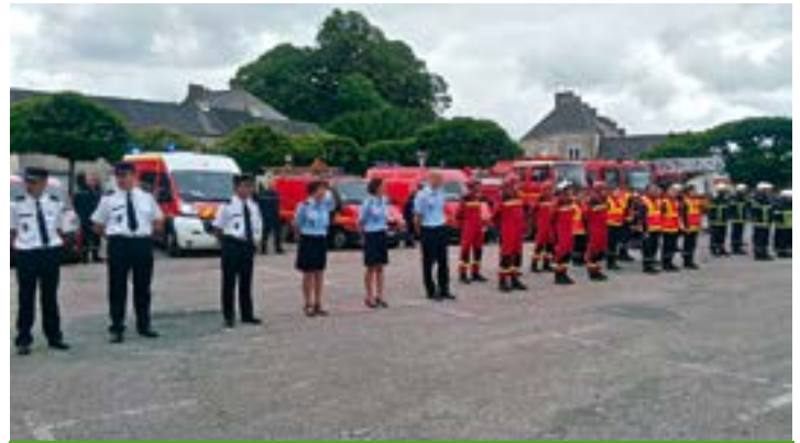
Revue des troupes