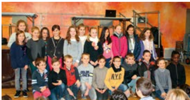
Le conseil fraîchement élu

Sur le sujet des espaces de jeux, qui la concerne au premier chef, la commission Bâtiments-jeux s'est montrée active. En juin, elle a pris part aux travaux du conseil sur le City park (structure ludique sous forme de petit terrain de foot et basket). Cette discussion avec les adultes et le dépouillement des propositions émises suite à l'appel d'offres ont abouti à un report du projet, la réflexion sur le type de revêtement n'étant pas aboutie. Une bonne expérience de gestion et de réalisme, qui profitera au prochain conseil. Le transfert du skate park, de l'ancien parking du Bricomarché à la Plaine d'aventures, a quant à lui été achevé au mois de juillet. Il a nécessité le démontage et la remise en état des modules, assemblés sur une nouvelle couche d'enrobé. De nouveaux modules sont envisagés, le prochain conseil aura encore de quoi réfléchir !