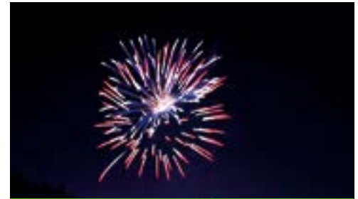
Feu d'artifice du 13 juillet

Sous un ciel clément, les festivités du 13 juillet ont idéalement lancé les vacances d'été. Les animations prévues ont drainé un large public, bien au-delà de la population villainaise, en particulier le feu d'artifice, tiré aux abords d'un stade noir de monde. Auparavant, la randonnée en ville, le défilé aux flambeaux et le spectacle donné par l'orchestre ont progressivement fait monter l'ambiance. Le thème de la magie, retenu cette année, ne pouvait trouver meilleur contexte pour être exprimé.