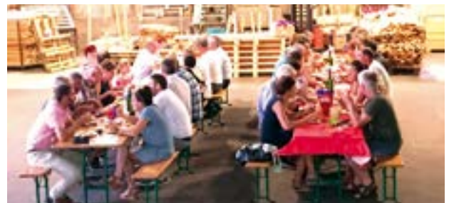
Des liens conviviaux à privilégier

Vendredi 7 juillet, la troisième rencontre artisans-commerçants a fourni à une cinquantaine de professionnels du secteur une occasion de rencontre privilégiée. Un programme convivial les attendait à l'entreprise Palettes 53, structure familiale qui fête ses 40 années d'existence. La visite de la chaîne de production a été suivie d'un barbecue. Ce concept simple est adapté à l'objectif : favoriser les échanges et, pourquoi pas, faire émerger de nouvelles opportunités commerciales.