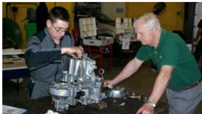
En 2010, en pleine épreuve du concours national, à Mulhouse.

Au cours de ses dernières années de formation, le projet de se mettre à son compte l'habite déjà. Une ardeur qu'il a depuis réfrénée. Il ne faut pas confondre vitesse et précipitation... Témoin des évolutions majeures dont la mécanique auto a été l'objet ces dix dernières années, il entend préparer au mieux son avenir.